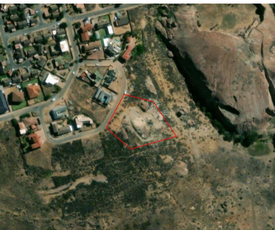
Legend Map Center: Lon: 37°58'46.7"E Lat: 32°50'14.6"S Scale: 1:2,257 Date created: August 14, 2023 Western Cape

ORIGINAL PLAN LIGTING: 11.08.96 KORREK: 11.08.96 Sign: DEY 25.01.96